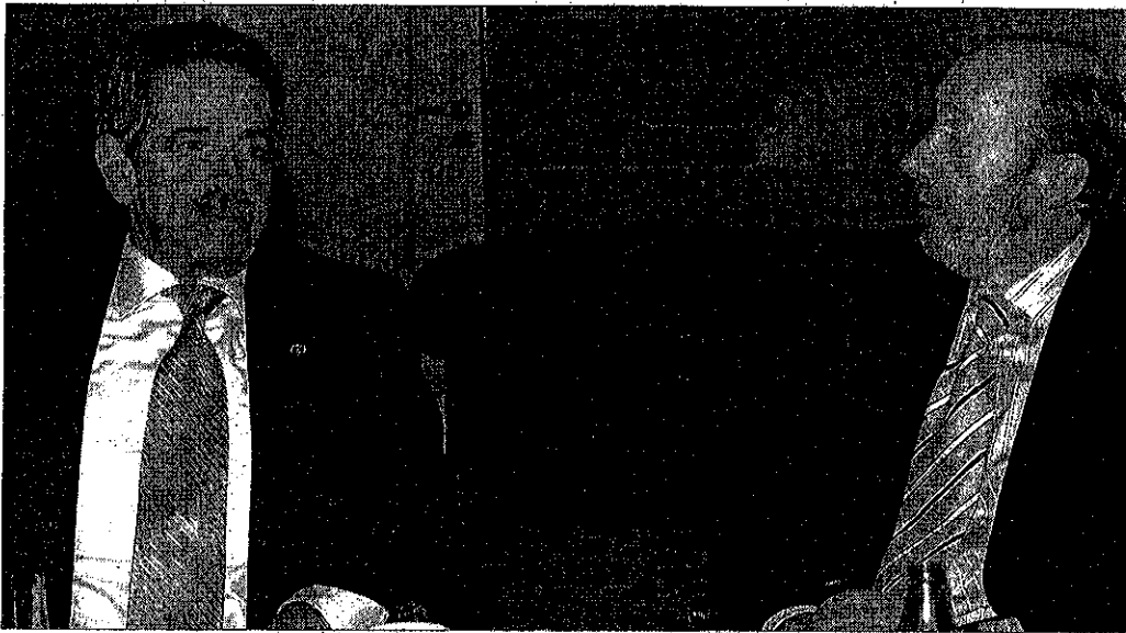
Miguel Ángel Revilla y Alfredo Pérez Rubalcaba durante la reunión mantenida ayer en Madrid.