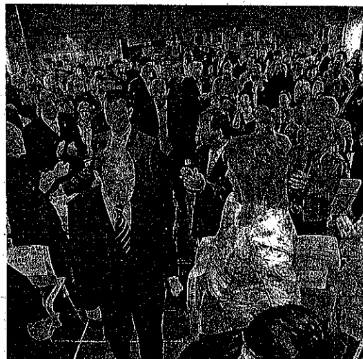
Pérez Rubalcaba acude asiduamente a actos del PSC-PSOE. En la foto, inauguración de la sede socialista en Pontejos.

Tanto la vicepresidenta regional como el ministro del Interior realizarán balance del año terminado, de la legislatura que está a punto de finalizar y de las expectativas de futuro tanto del Partido en Cantabria como en el resto de España.