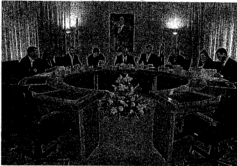
Reunión de trabajo de la comisión permanente de la Coprepa, en el Parlamento cántabro.

El representante catalán señaló que el «clima de crispación política» en torno a las reformas estatutarias, que no existió en la Coprepa, «se ha calmado» y pasado el tiempo se ha comprobado que «no ha pasado nada» y «la sangre no ha llegado al río». En Castilla y León se ha aprobado una reforma por consenso, precisó Fernández Santiago.